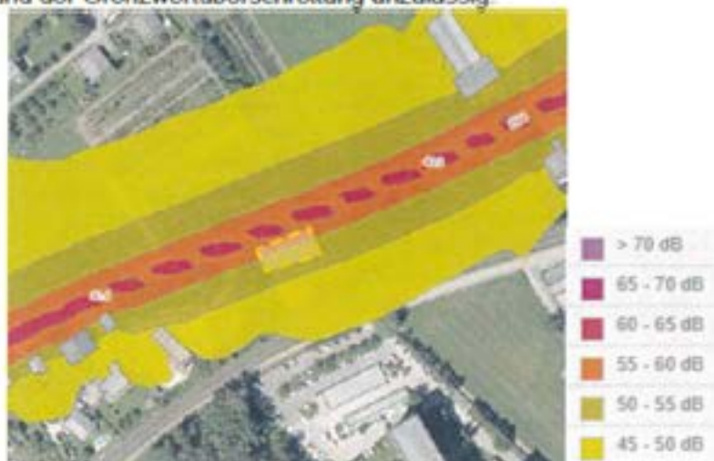
Aus: strategische Lärmkarte, Bereich Tschöran

Auf Grund der gegebenen Verkehrsbelastung, die Widmungsfläche liegt in Lärmzonen zwischen 45-60 dB in der Nacht, sollte im unmittelbaren Straßennahbereich eine Bebauung mit untergeordneten Objekten (Nebengebäude, Garage) erfolgen, eine Bebauung mit Wohnbauten ist in diesem Bereich auf Grund der Grenzwertüberschreitung unzulässig.